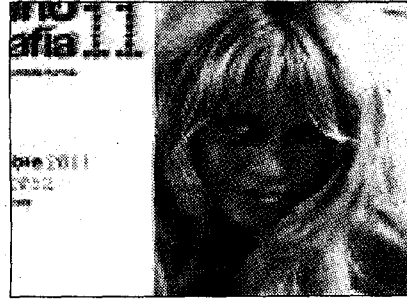
BB nella locandina della manifestazione