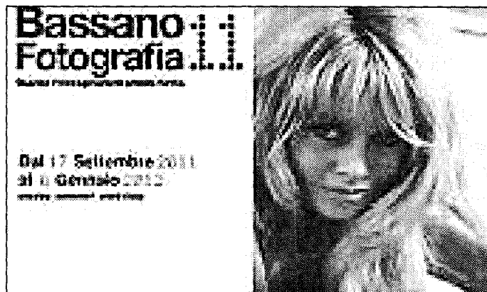
La locandina della manifestazione con Brigitte Bardot

Al centro dell'evento organizzato da Pro Bassano, Comune e Manfrotto+Co, le immagini impresse sulla pellicola da alcuni grandi maestri come il canadese Douglas Kirkland, il celebre fotografo degli artisti, del quale in Museo si possono ammirare 25 ritratti di altrettanti divi, come Sofia Loren, Jack Nicholson, Roberto Bolle, Brigitte Bardot, Nicole Kidman, Antonio Banderas solo per citarne alcuni. Altrettanto d'impatto la